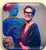
Dr.ssa Vera Gheno

Laureata in Sociologia, ha svolto esperienze di volontariato in Italia in diverse strutture sociali e socio-sanitarie, presso associazioni che si occupano di sport e disabilità, nei servizi di urgenza ed emergenza, e in Africa in centri per bambini. Ha lavorato per molti anni nel campo dell'assistenza, della cura, dell'educazione e dell'accoglienza di persone adulte con disabilità intellettiva. Ha diretto una Comunità Alloggio a Como, è stata assessore alle Politiche Sociali e Vicesindaco, parlamentare e assessore alle Politiche sociali e della Famiglia di Regione Lombardia. Dal 22 ottobre 2022 è Ministro per le Disabilità nel governo Meloni.